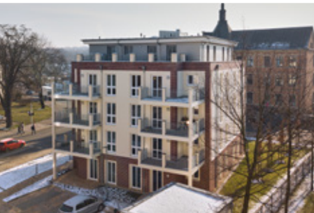
Apartments in der Villa