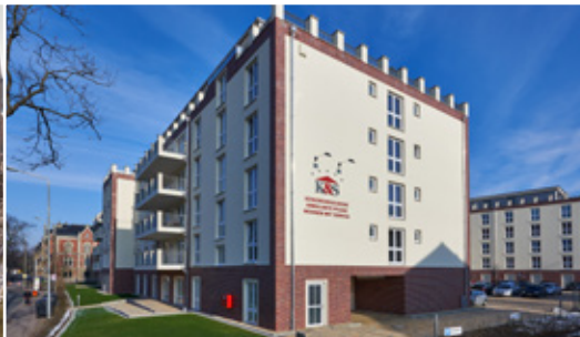
Apartments in der Seniorenresidenz